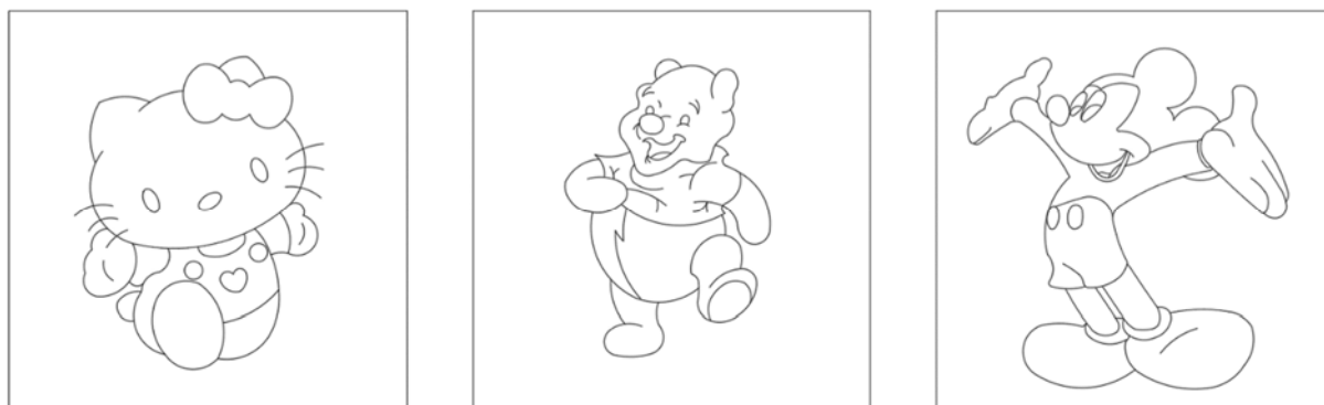
图2 需要内置的图案

(3) PLC 控制程序设计：根据提供的电气原理，编写能符合上述功能要求的 PLC 程序。